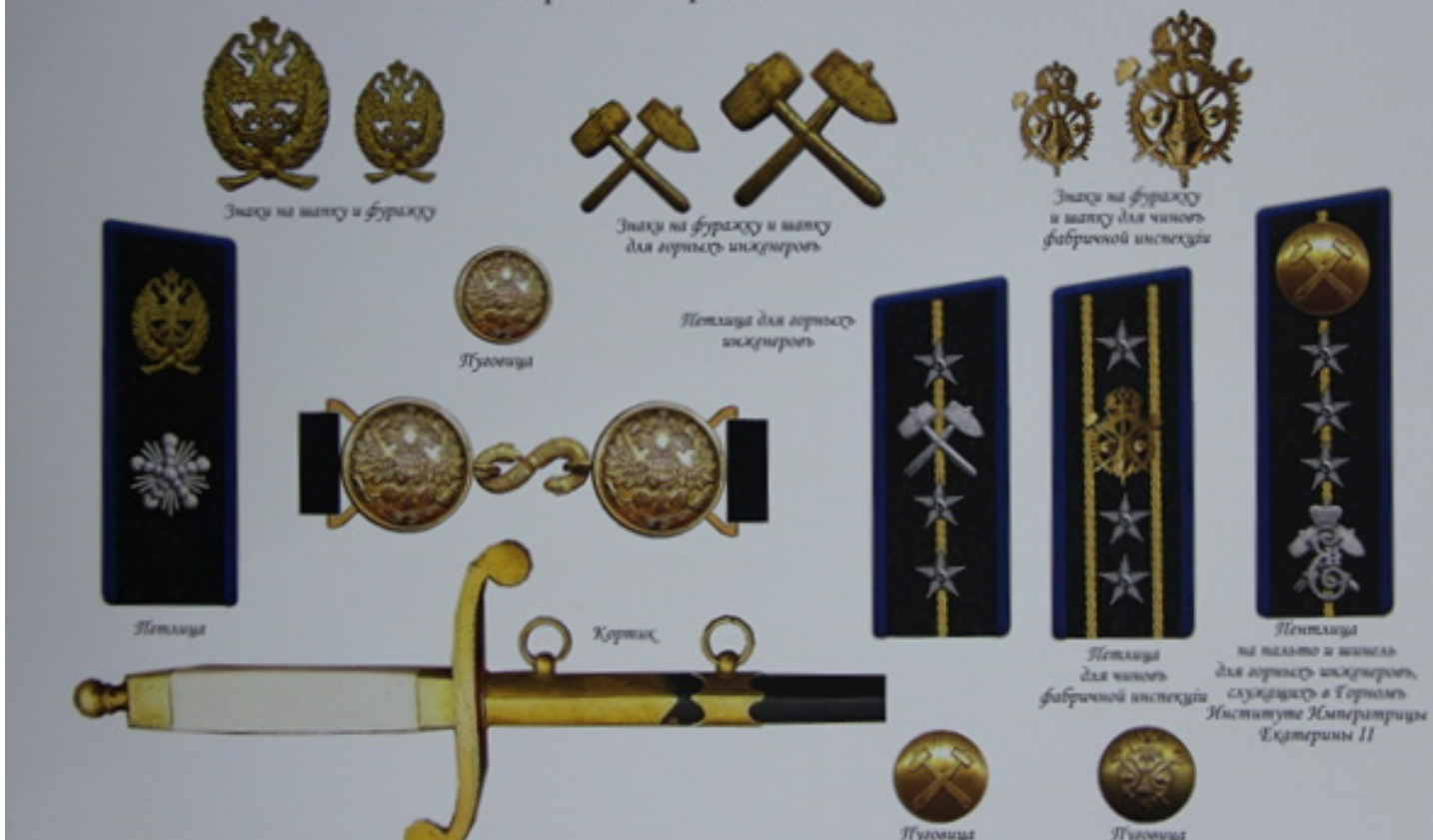
Отличительные знаки для чинов фабричной инспекции – знаки на фуражку, петлицы и пуговицы (правая сторона)

форменной одежды для гражданских чиновъ ведомства Министерства Торговли и Промышленности